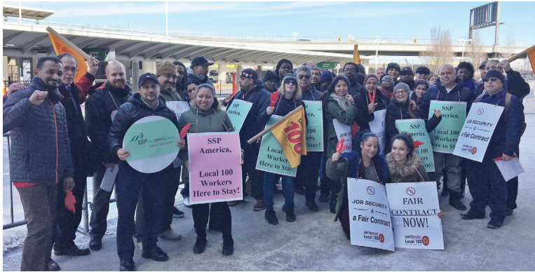
Los trabajadores de concesiones de SSP y Host en el Aeropuerto JFK Terminal 7 el 20 de marzo.

de SSP. Al hacerlo, la compañía ha acordado restablecer los salarios y respetar la antigüedad de nuestros miembros. Además, los miembros de SSP que anteriormente se beneficiaron con el seguro de salud y el estacionamiento de HMS Host continuarán recibiendo estos beneficios y muchos de los que renunciaron durante la reducción de horas serán reintegrados.