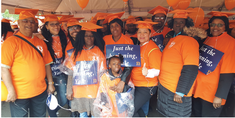
Local 100 afuera de la ceremonia de graduación de la Universidad de Yale en New Haven, Connecticut.

El 22 de mayo, UNITE HERE Local 100 se reunió fuera de la ceremonia de graduación de la Universidad de Yale en New Haven, Connecticut junto a miles de miembros de UNITE HERE de toda la costa este en una