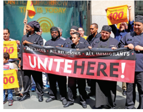
Compass, Flik at NBC