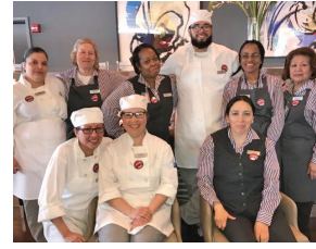
Flik, British Airways Lounge at EWR