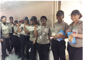
Cashiers at Madison Square Garden