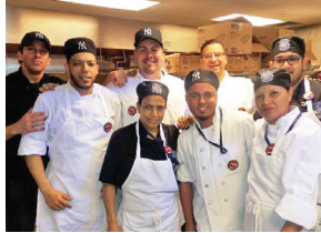
Food Preps & Cooks at Yankee Stadium