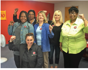
Committee & Shop Steward, Legends at Prudential Center