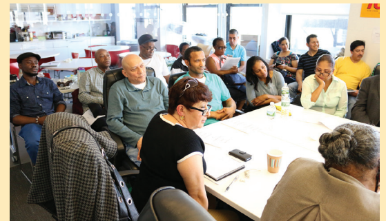
En el principio de las negociaciones del 2017, el comité de negociaciones de Local 100 le da la propuesta a los Supervisores de Aramark en la oficina del Sindicato en Local 100 en Nueva York