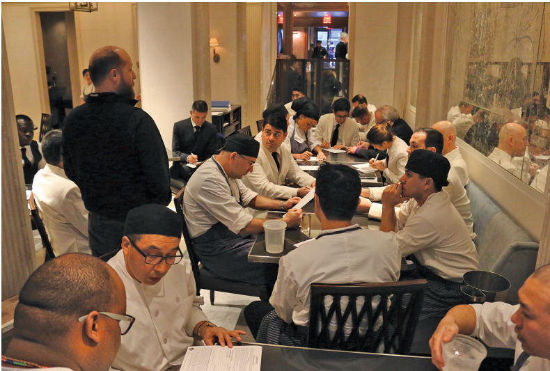
Food service workers at Majorelle signing Union checkoff cards on March 2nd, 2017

On March 16th, the newly organized French restaurant in Midtown Manhattan, Majorelle, ratified a strong first contract. UNITE HERE! Local 100 began the process of organizing the restaurant earlier this year. Working with committee at Majorelle and through many conversations and meetings, the