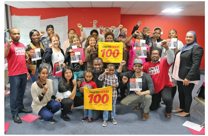
Members of Local 100 at Newark Office at June 3rd Training

“We strive to provide hard working men and women a real opportunity to provide for