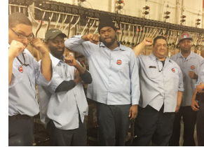
Warehouse workers at Madison Square Garden