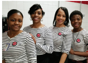
Riviera, OTG at EWR