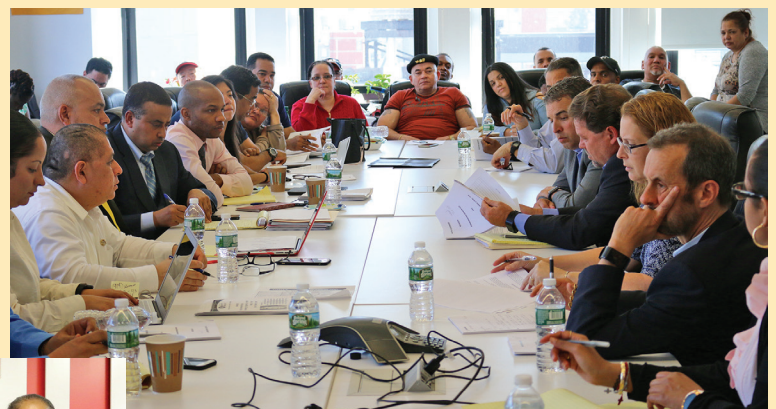
The Local 100 negotiating committee (at left) gives contract proposal to Aramark management at the New York Local 100 union office, in the opening meeting of 2017 contract negotiations.