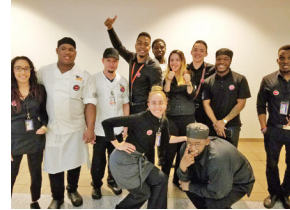
Happy Clam and Gate Hole OTG at EWR