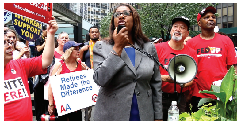
New York City Public Advocate Letitia James is urging shareholders of American Airlines to raise the wages of its food service workers.