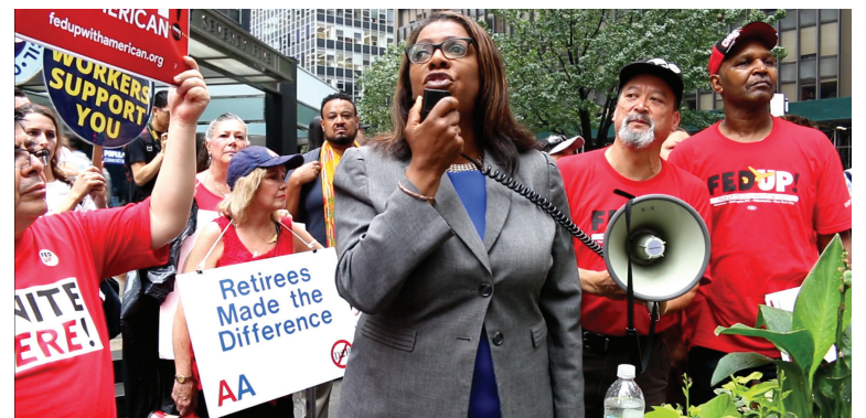
La Defensora Pública de la Ciudad de Nueva York, Letitia James, les está insistiendo a los accionistas de American Airlines a aumentar los salarios de sus trabajadores de los servicios alimenticios.