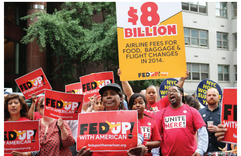
Local 100 members demonstrating at American Airlines annual shareholders meeting in midtown Manhattan on June 14th.

Public Advocate Letitia James joined the action saying “We... say to the shareholders of American Airlines, you are enjoying record profits and all that we are asking is for respect and dignity for workers who made this airline profitable.” What we want is to make sure that our families can enjoy the benefits about labor. Right now we are struggling and we oppose any attempts to pay us less than minimum wage. It is irresponsible, unacceptable and we will not accept it. The Workers all across this nation are joining up and were going to coalesce and were going to be together and we are going to demand dignity and respect for all workers.”