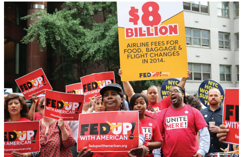
Miembros de la Local 100 haciendo una demostración frente a la reunión de los accionistas de American Airlines en el medio de Manhattan el 14 de Junio.

La Defensora Pública Letitia James se unió a la acción diciendo: “Nosotros... decimos a los accionistas de American Airlines, están disfrutando de ganancias récord y todo lo que estamos pidiendo es respeto y dignidad para los trabajadores que hicieron lucrativa esta aerolínea”. Lo que queremos es hacer que nuestras familias puedan disfrutar de los beneficios del trabajo. En este momento estamos luchando y nos oponemos a cualquier intento de pagar menos que el salario mínimo. Es irresponsable, inaceptable y no lo aceptaremos. Los trabajadores de toda la nación se unen y se van a unir y van a estar juntos y vamos a exigir dignidad y respeto a todos los trabajadores.”