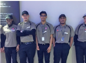
Club Seat Runners at Madison Square Garden