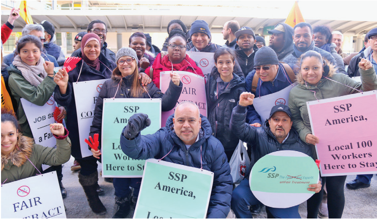
Airport concession workers of JFK Airport who work for SSP and Host at the March 20th rally in front of Terminal 7.

May 18th the company agreed to restore wages and respect our members' seniority. In addition, SSP members who previously benefited from health insurance and parking from HMSHost will continue to receive these benefits and many who quit during the reduction of wages will be offered reinstatement.