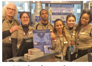
Merchandise workers at Madison Square Garden