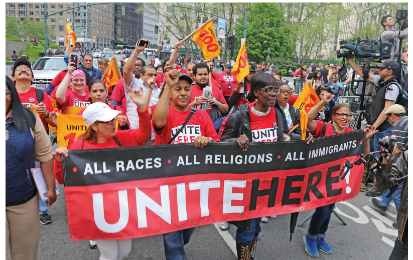
Members of Local 100 march through downtown Manhattan during rally on May 1st