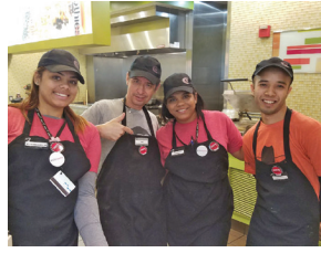
Currito's, Areas at EWR