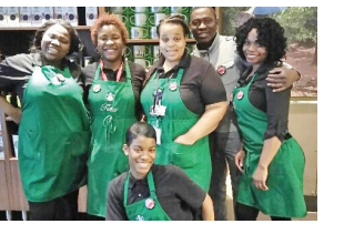
Starbucks at EWR