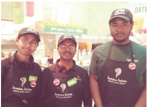
Jamba Juice, Creative Food Group at EWR