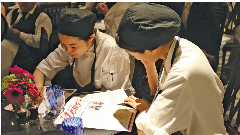
Los trabajadores de comida en el restaurante Majorelle firman para entrar a la Unión el 2 de marzo del 2017.

El 16 de marzo, el restaurante francés recién organizado en el centro de Manhattan, Majorelle, ratificó un primer contrato fuerte. UNITE HERE! Local 100 comenzó el proceso de organizar el restaurante a principios de este año. Trabajando con el comité en Majorelle y a través de muchas conversaciones y reuniones, los trabajadores obtuvieron el recon-