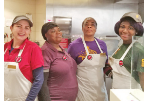
Q'doba, Midfield Concessions at EWR