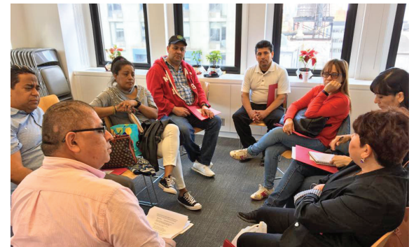
En la oficina de Nueva Jersey el 3 de Junio, Miembros de la Local 100 repartiéndose en grupos para hablar de los beneficios de tener Unión.

La primera capacitación introdujo a los miembros a las leyes de “Derecho al Trabajo” y les enseñó cómo acercarse a un trabajador para unirse a la Unión. La segunda reunión discutió las esperanzas y los sueños de los miembros para el trabajo y sus vidas familiares y lo que han logrado con la ayuda del sindicato. Por último, en la