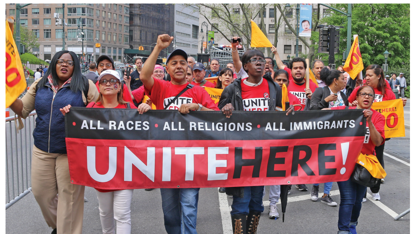
Miembros de la Local 100 marchan en el centro de Manhattan en una demostración el 1 de mayo.

Para ver más fotos del 1ro de mayo, ver página 2.