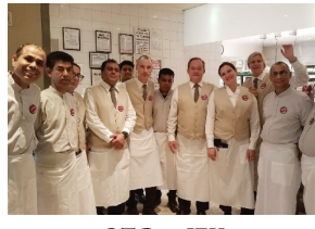
OTG at JFK