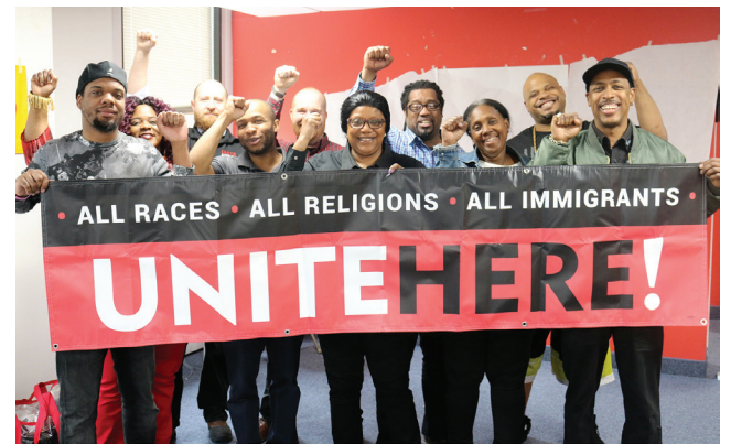
Miembros de la Local 100 en el entrenamiento del 3 de junio en la oficina de Newark.

“Nos esforzamos por brindar a los trabajadores y trabajadoras