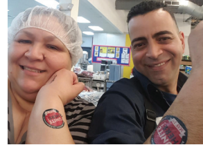
Gate Gourmet at EWR