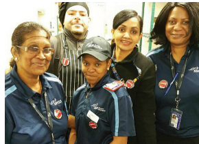
SSP America at JFK T-4