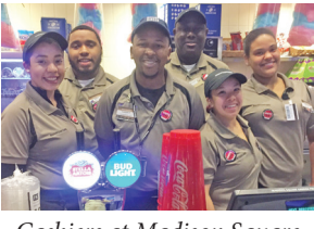
Cashiers at Madison Square Garden