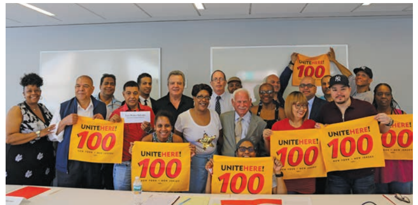
Newly elected executive board, trustees and officers, taking the oath at their installation on June 19th. See page 2.