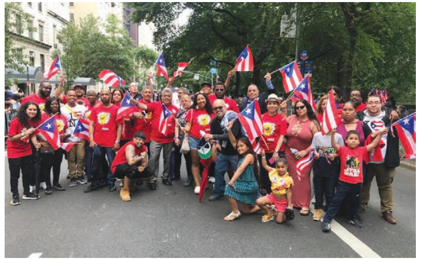
Puerto Rican Day Parade, Sunday, June 10