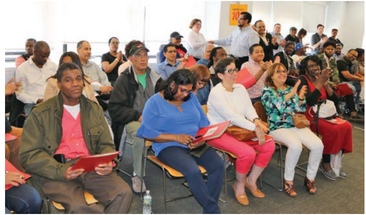
Shop Steward Training, Saturday, April 14th