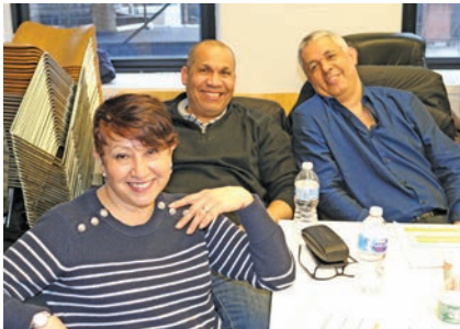
May 16, Aramark Negotiations

Ratification votes continue for Compass master contract. Approximately 60 out of 65 shops have been ratified. In addition, negotiations began for The Old Homestead Steakhouse on April 12th. The first meeting consisted of making proposals to renew their existing contract. Also, negotiations continue for 1,200 Madison Square Garden food service workers. Their contract expired on May 31, 2017, and after 13 months of negotiations, an agreement has not been reached. On April 13th UNITE HERE Local 100 held a rally in support of MSG food service workers to demand an answer from the company and pressure them to agree on a contract. Moreover, victory for The New School cafeteria workers was achieved on May 7, 2018. The company agreed to extend its Union contract and maintain benefits.