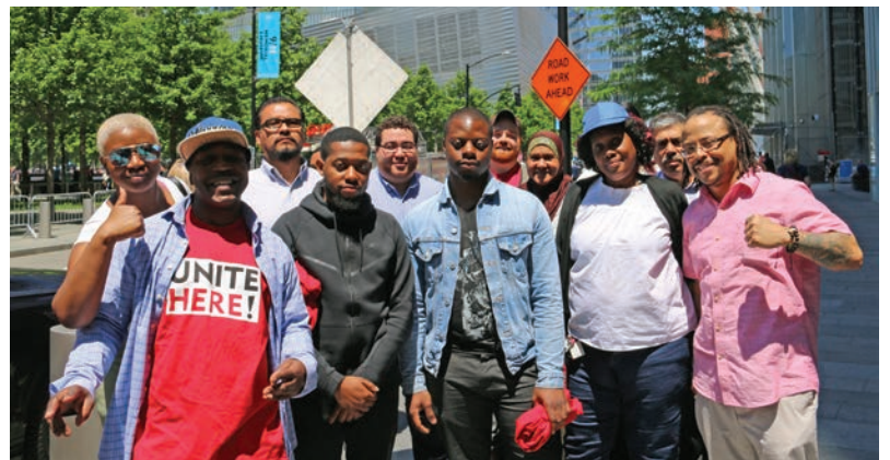
May 24, Port Authority Board Meeting

UNITE HERE Local 100 followed up on the Port Authority minimum wage victory in March by holding meetings in airport shops to train members on sending comments to the Port Authority. Nearly 300 comments were sent to the PANYNJ in support of raising the minimum wage to $19 an hour for all airport workers, including airline catering workers in New York and New Jersey. A final decision will be announced at the Port Authority meeting on June 28th.