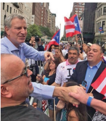
Parada Puertorriquena, Domingo 10 de Junio