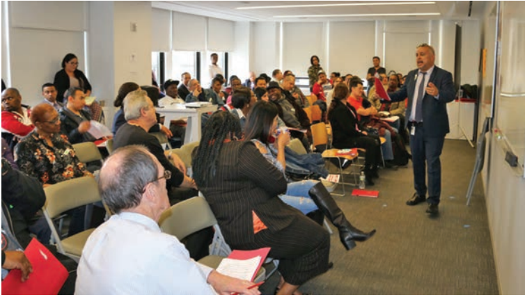
General Membership Meeting Tuesday, April 24th