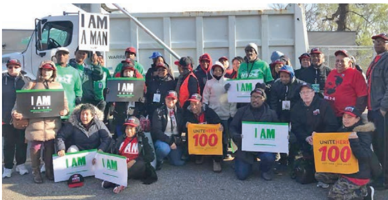
April 4, UNITE HERE Local 100 with Memphis Sanitation workers.