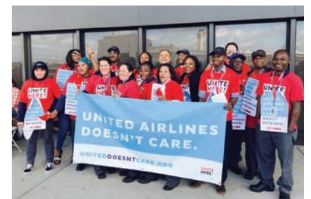
23 de mayo, trabajadores de United Airlines en el aeropuerto de Newark