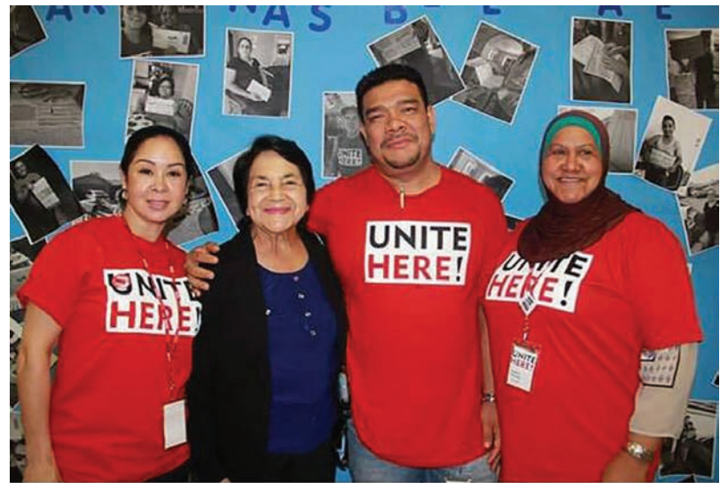
Political work in Arizona October- November Trabajo político en Arizona octubre-noviembre