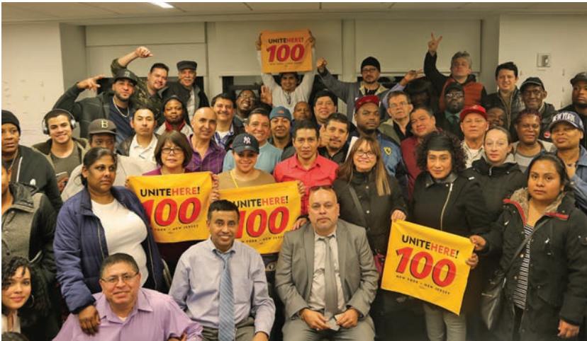
Compass Negotiations February 28 Negociaciones de Compass - 28 de febrero