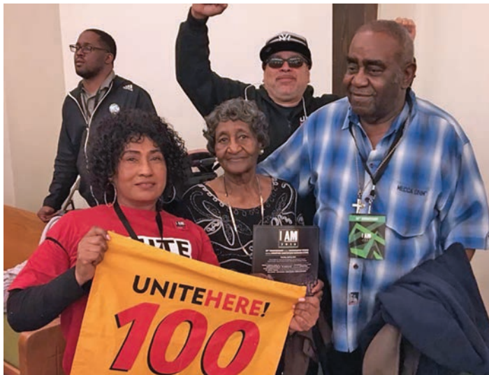
I AM 2018 Memphis, Tennessee, April 3-4. Del 3 al 4 de abril.