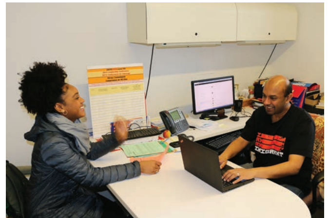
Citizenship Clinic November 26 Clínica de ciudadanía 26 de noviembre