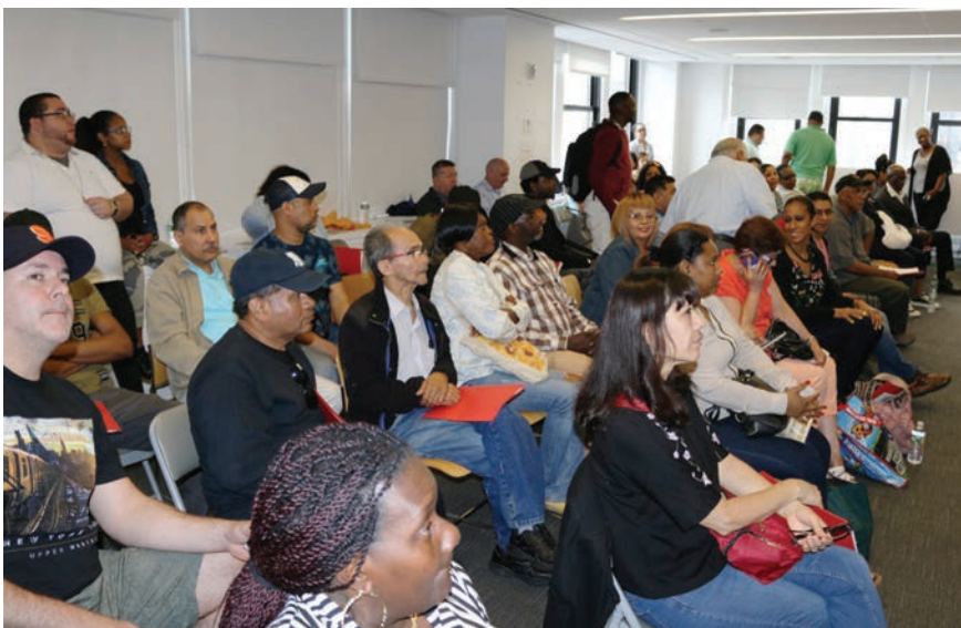
Shop Steward Training June 23 Entrenamiento de Delegados Sindicales 23 de junio