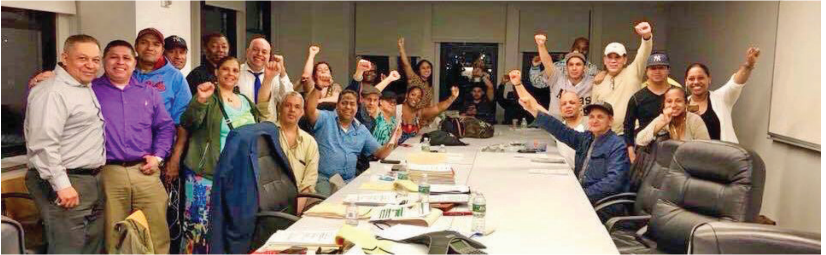
Aramark Negotiations May 24-25 until 4:00 a.m. Negociaciones de Aramark del 24 al 25 de mayo hasta las 4:00 a.m.