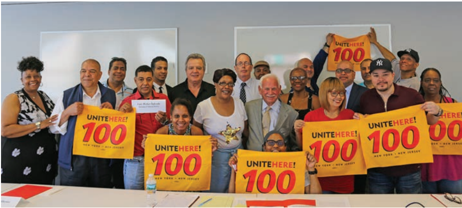
Newly Elected Executive Board June 19 Junta Ejecutiva recientemente electa el 19 de junio