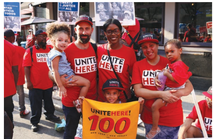
Labor United to Free the Children Rally Philadelphia, Pennsylvania, August 15. El movimiento Laboral Unido Para Liberar a los Niños Filadelfia, Pensilvania 15 de agosto.