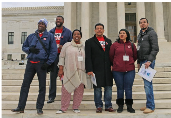
Lobbying for TPS in Washington D.C. February 6 TPS en Washington DC el 6 de febrero