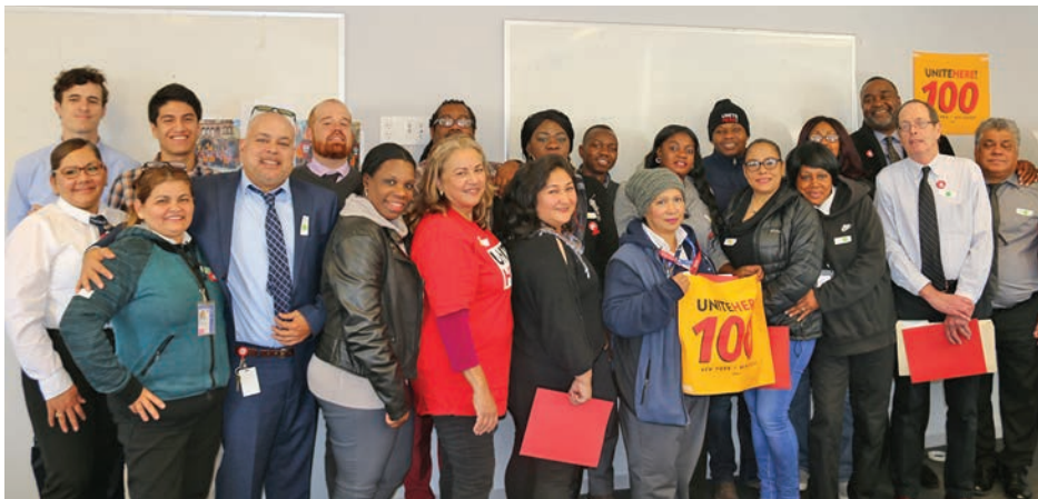
General Membership Meetings October 30 Reuniones generales de membresía 30 de octubre