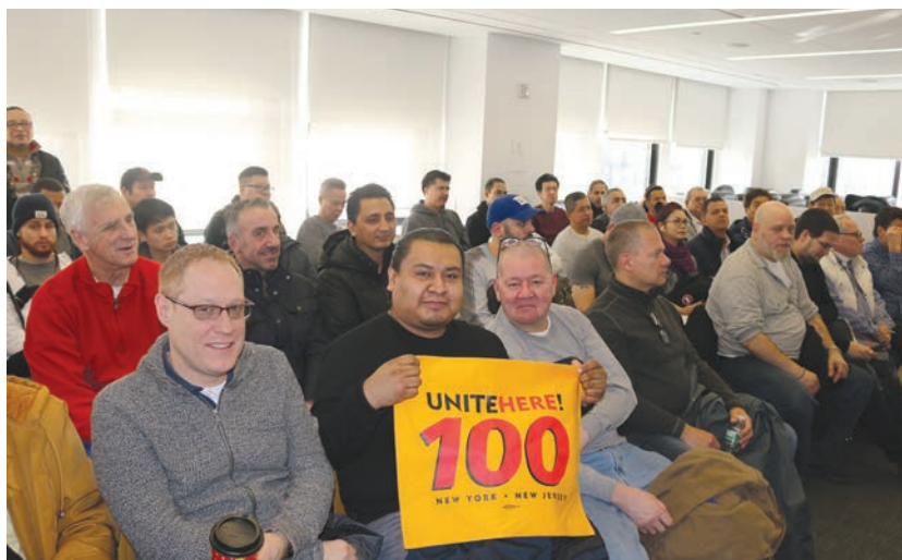
Smith and Wollensky Closed by Fire December 1. Meeting December 6. Smith y Wollensky cerrados por incendio el 1 de diciembre. Reunión el 6 de diciembre.