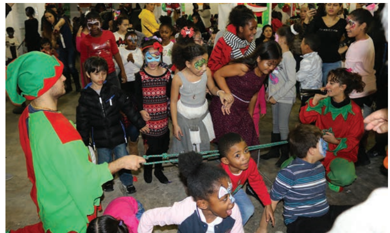
New York members' and children's Holiday Parties December 7-8 Miembros de New York y fiestas navideñas para niños el 7 y 8 de diciembre