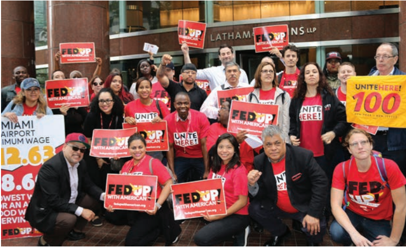
American Airlines Shareholders Rally June 13 Rally de Accionistas de American Airlines 13 de junio