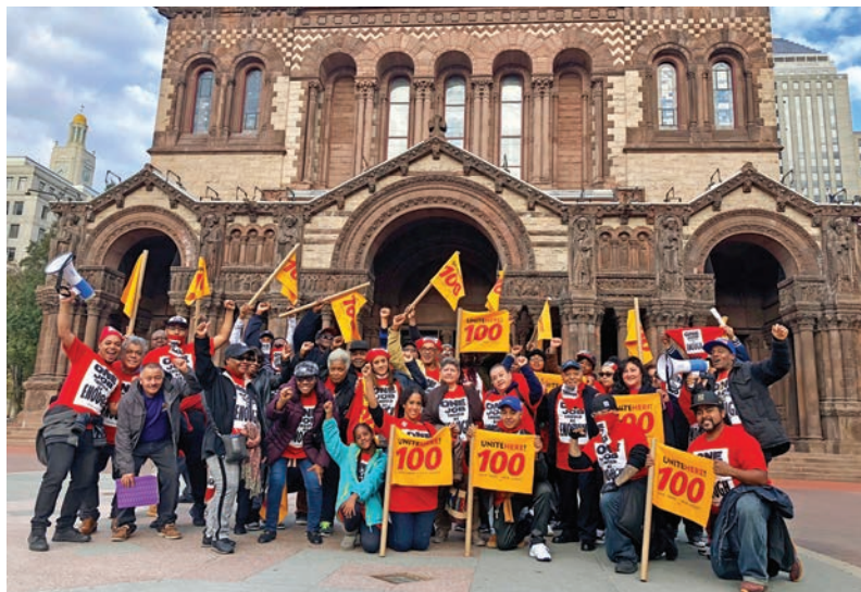
Boston Marriott Strike October 20 Huelga en "Boston Marriott" 20 de octubre