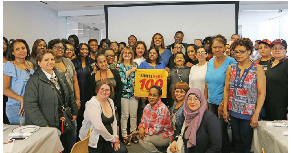
Women in the Labor Movement Recognition Event April 14. Evento de reconocimiento de las mujeres en el movimiento laboral 14 de abril