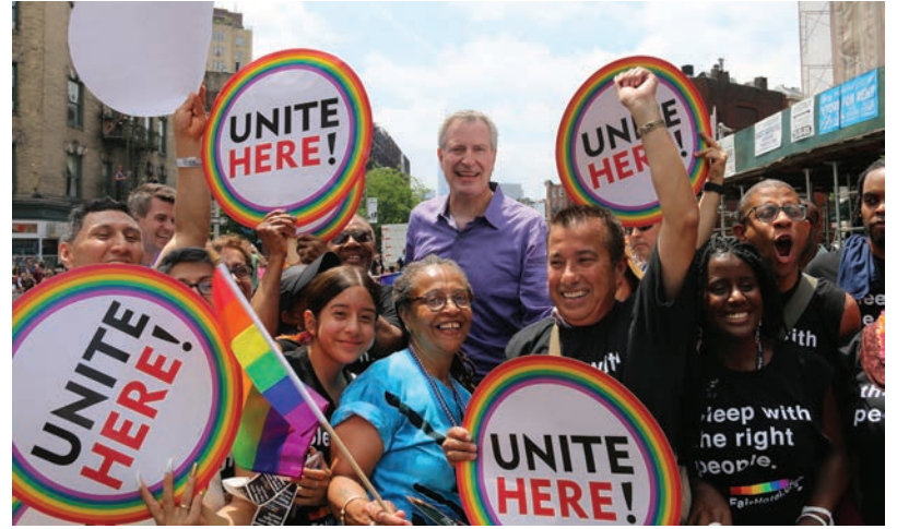
Pride Parade June 24 Parada "Pride" 24 de junio