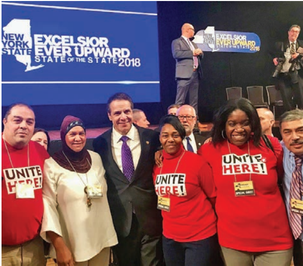
2018 State of the State Address January 3 2018 Estado del Estado Dirección 3 de enero