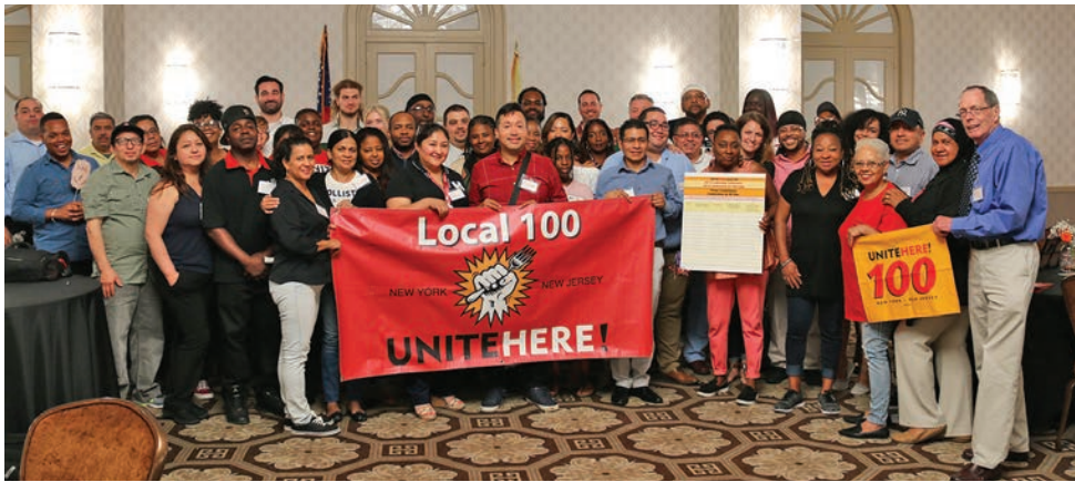
2018 Leadership Conference August 24 and 25 2018 Conferencia de Liderazgo 24 y 25 de agosto