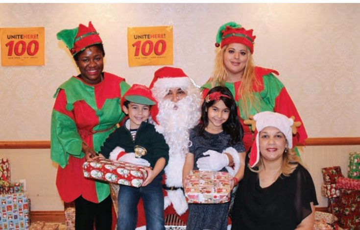
New Jersey members' and children's Holiday Parties November 30 and December 15. Miembros de New Jersey y fiestas navideñas para niños el 30 de noviembre y 15 de diciembre.