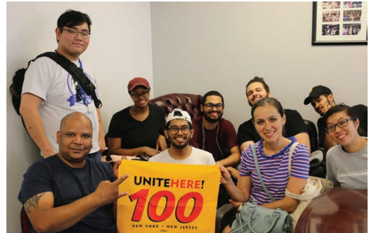
Flagship at Facebook Ratification August 31 Flagship en Facebook Ratificación 31 de agosto