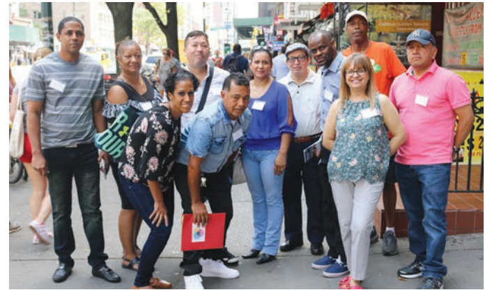
Political Committee August 25 Comité político 25 de agosto