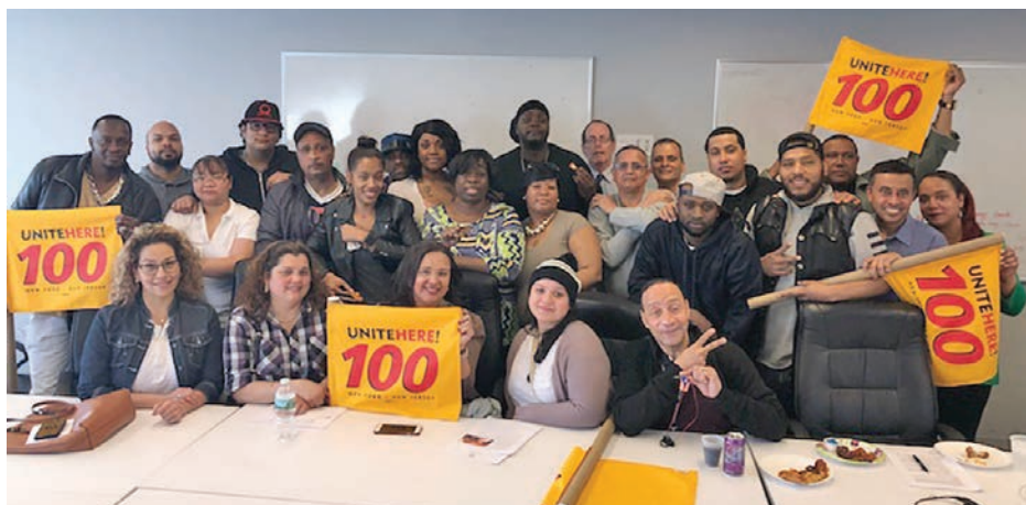
The New School May 9, el 9 de mayo.