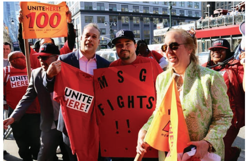
Madison Square Garden Rally April 13 Rally del Madison Square Garden 13 de abril