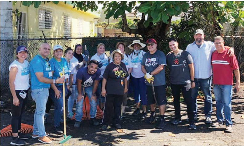
SOMOS Puerto Rico Conference November 7-11 SOMOS Conferencia de Puerto Rico 7-11 de noviembre