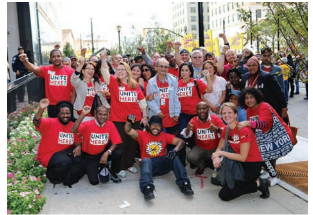
Port Authority Board Meetings September 27 Reuniones de la Junta de la Autoridad Portuaria del 27 de septiembre