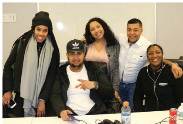
Izquierda: United elecciones. Derecha: Google Ratificación.