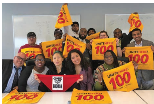
Left: United Election Vote. Right: Google Ratification.