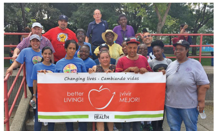
Better Living Picnic August 18 Picnic de "viviendo mejor" 18 de agosto