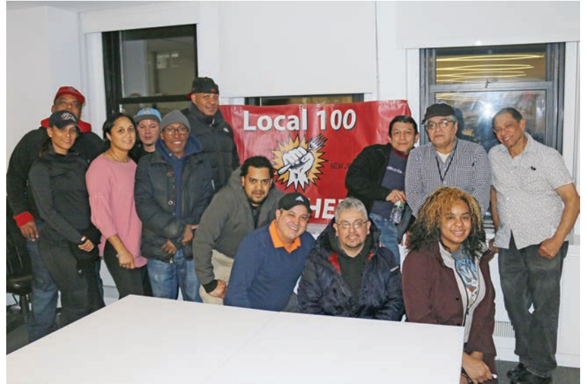
English Classes for Citizenship on January 3rd

reading, writing, and verbal skills in order to pass their citizenship exam. Classes are every Thursday from 4:30 p.m. to 6:30 p.m. at 275 7 th Ave., 16th Floor.