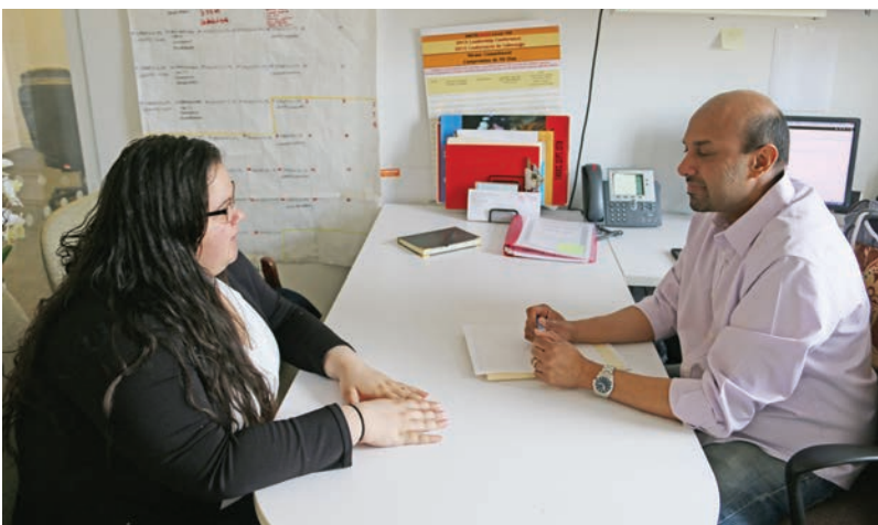
January Citizenship Clinic

UNITE HERE Local 100 holds free monthly Citizenship clinics with an immigration lawyer. The next Citizenship clinic will be held on Monday, April 29 th at 9:30 a.m. at 275 7th Ave, 16th Floor.