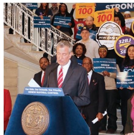
La Local 100 con el alcalde Bill de Blasio el 7 de marzo

El 7 de marzo, el presidente de UNITE HERE Local 100, Bill Granfield, habló junto al alcalde Bill de Blasio en apoyo de la extensión del control de la alcaldía sobre las escuelas públicas de la Ciudad de Nueva York. Bajo el sistema actual de control de la alcaldía, las tasas de graduación de los estudiantes y los puntajes en los exámenes han seguido aumentando a medida que disminuyen las tasas de deserción. Además, Pre-K se extenderá a los niños de 3 años. La Local 100 apoya esta extensión de tres años para continuar con el avance de nuestro sistema educativo para los 1.1 millones de estudiantes matric-