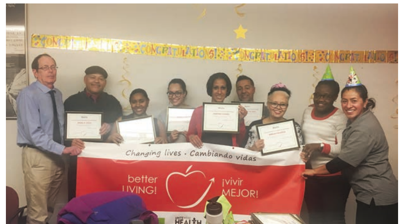
UNITE HERE Health Better Living Graduation

UNITE HERE Health offers three free programs of Better Living , that teach members how to manage symptoms with tools for healthy eating, exercise, pain relief, and stress management, Living better with Diabetes , which offers free test strips, lancets and glucometers, and