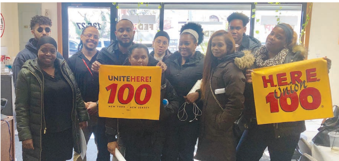
Reunion de OTG el 23 de marzo