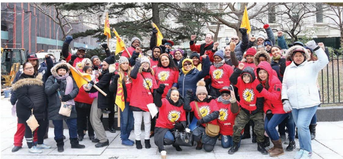
Local 100 members and staff at Women's Unity Rally on January 19th

of other faith and community allies. Local 100 continues to push forward women's voices in the labor community and in the food service industry in order to build the power of women in the workplace.