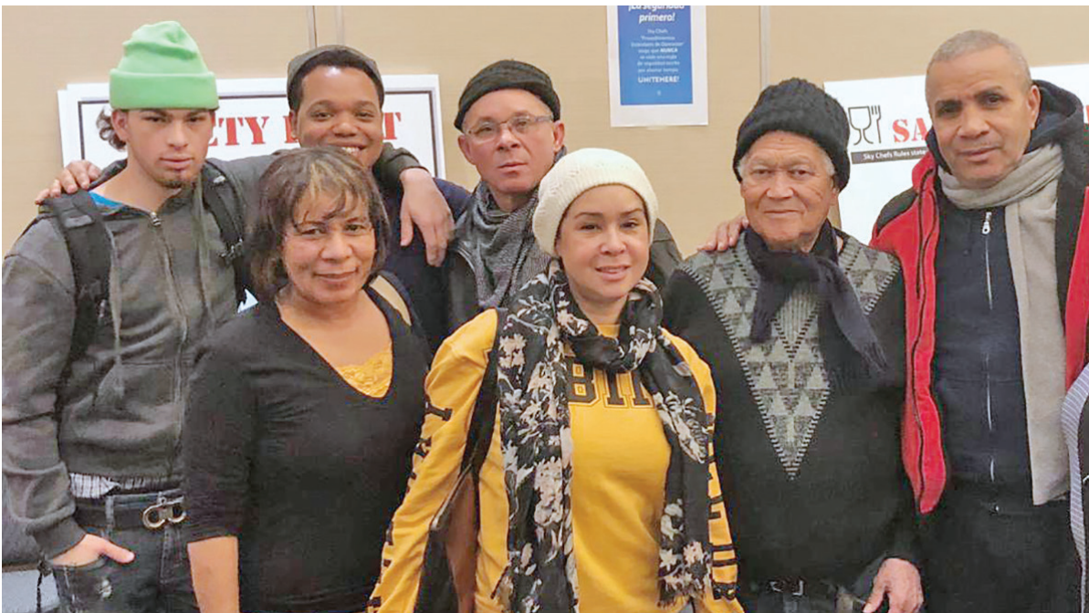
Miembros de la Local 100 de Sky Chefs en el entrenamiento de “Conozca sus Derechos” el 13 de febrero

Los miembros de Centerplate en Jacob Javits Center se enteraron en marzo de que la compañía Levy ganó la licitación y reemplazará a Centerplate como operador. Se espera que la fecha de transición sea el 15 de junio. Los trabajadores se reunieron con representantes sindicales el 19 de marzo para preparar reuniones con Levy.