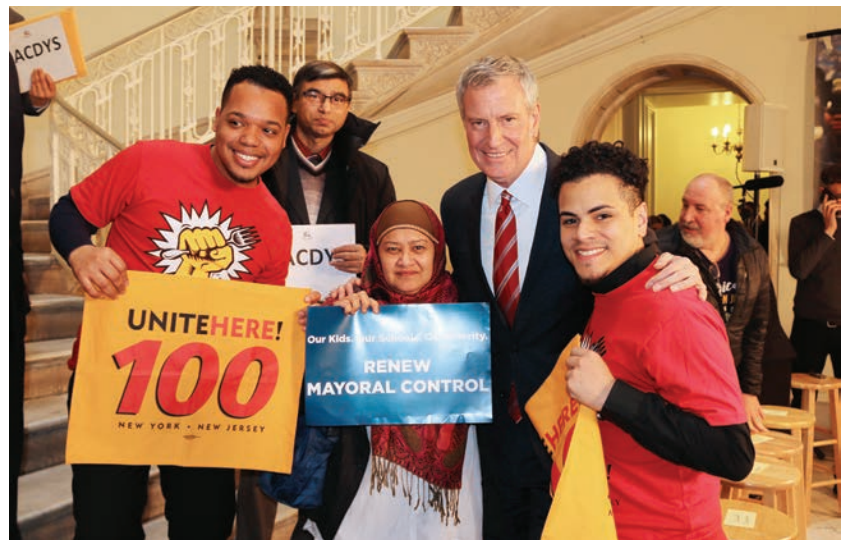
Local 100 with Mayor Bill de Blasio on March 7th

decline. In addition, Pre-K will be extended to 3-year olds. Local 100 supports this three year extension to continue the advancement of our education system for the 1.1 million students enrolled in NYC schools and to further the vision of Equity and Excellence not bound by demographics or income.