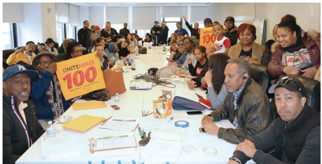
Jacob Javits Center Meeting on March 19th