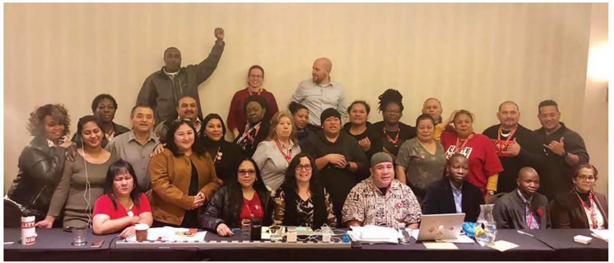
United Committee members at negotiations in Newark, New Jersey on March 12th

In new organizing, 1,200 new airline catering members at United Airlines in Newark, New Jersey had their first negotiation sessions for their first contract on March 12 th and 13 th . The Union, Local management, and 22 committee members attended negotiations and discussed improving conditions. An Interim Agreement will go into effect on March 25 th and negotiations will continue on April 9 th and 10 th in Houston.