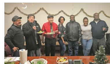
UNITE HERE Health taller de Salud Integral

UNITE HERE Health ofrece tres programas gratuitos de Salud Integral, que enseñan a los miembros cómo manejar los síntomas con herramientas para una alimentación saludable, ejercicio, alivio del dolor y control del estrés, Viviendo Mejor con Diabetes, que ofrece tiras reactivas gratuitas, lancetas y glucómetros, y Livongo, un programa para diabéticos con capacitación 24/7 por correo electrónico, texto o teléfono. Estos programas están abiertos a todos los miembros cubiertos