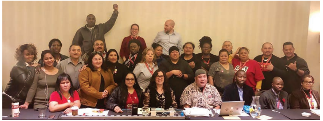
Miembros del comité de United en las negociaciones en Newark, New Jersey, el 12 de marzo

interino entrará en vigencia el 25 de marzo y las negociaciones continuarán el 9 y 10 de abril en Houston.