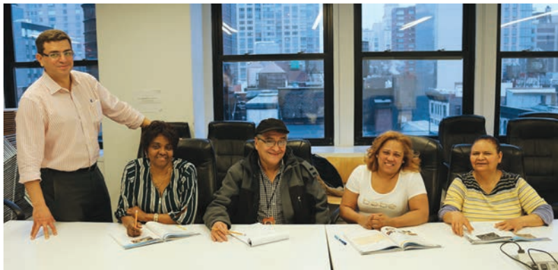
Clases de inglés para la ciudadanía el 21 de marzo

escritura y habilidades verbales para aprobar su examen de la ciudadanía. Las clases son todos los jueves de 4:30 p.m. a las 6:30 p.m. en 275 7th Ave., piso 16.