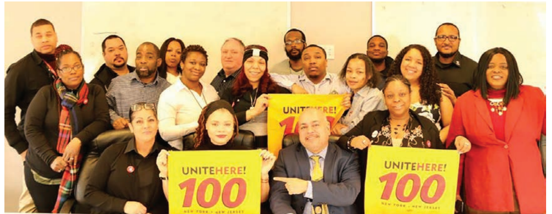
Barclays Center Negotiations on March 1st

On March 18 th the Union reached a tentative agreement with Borenstein Caterers . Members were able to maintain affordable health insurance under the UNITE HERE Health plan, as well as improve their pension. Members will begin to receive wage increases as per the Port Authority minimum wage policy.