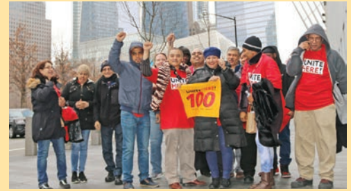
January 15th Martin Luther King Day Rally at Newark Airport

UNITE HERE Local 100 in action supporting wage increase for all airport workers including airline catering workers in 2018.