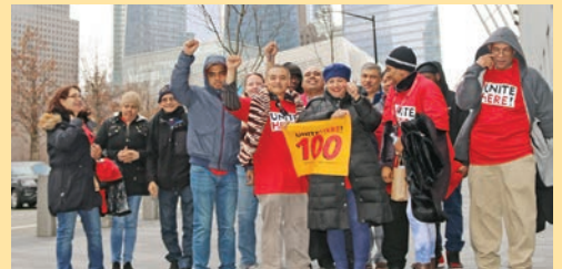
February 15th Port Authority Meeting