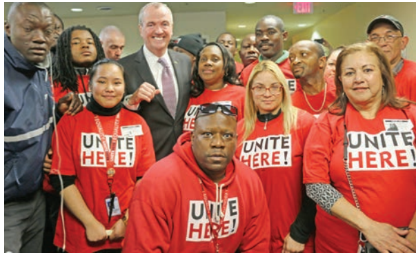
March 22 Port Authority Meeting

Special recognition goes to the hundreds of airport workers who have attended and spoken publicly at the