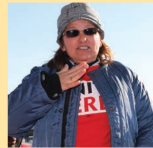
15 de enero Reunión del Día de Martin Luther King en el aeropuerto de Newark