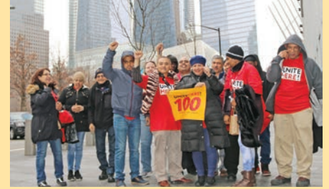
15 de febrero Reunión de la Autoridad Portuaria

UNITE HERE Local 100 en acciones que apoya el aumento salarial para todos los trabajadores del aeropuerto, incluidos los trabajadores de la industria de preparación de comida para aerolíneas en 2018.