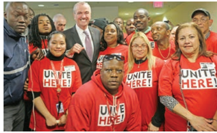
22 de Marzo reunion de la Autoridad Portuaria

Más de 5000 miembros de la Local 100 que trabajan en terminales de aeropuertos y cocinas de preparación de comida para las aerolíneas dieron un gran paso adelante el 22 de marzo. Ese día los comisionados de la Autoridad Portuaria de New York y New Jersey (PANYNJ) votaron para aumentar el salario mínimo por hora para los trabajadores del aeropuerto hasta $19 en 2023. Los trabajadores del aeropuerto de Newark obtendrán los mayores aumentos en los próximos 18 meses (para alcanzar el mínimo de $ 15 de Nueva York en 2019) y luego los mínimos para ambos grupos subirán en septiembre de cada año a $ 16.20, $ 17, $ 18 y $ 19. Los aumentos cubrirán a los trabajadores de las cocinas de preparación de comida para las aerolíneas, que quedaron fuera del aumento de $ 10.10 en 2014.