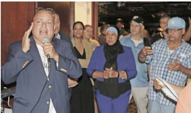
Presidente Jose Maldonado hablándole a los miembros durante el crucero Liberty.

máquinas de masaje y más. Estas reuniones subrayan las conexiones profundas que fortalecen la fuerza de nuestro sindicato mientras continuamos nuestra lucha de varios años por la dignidad y el respeto en los lugares de trabajo.