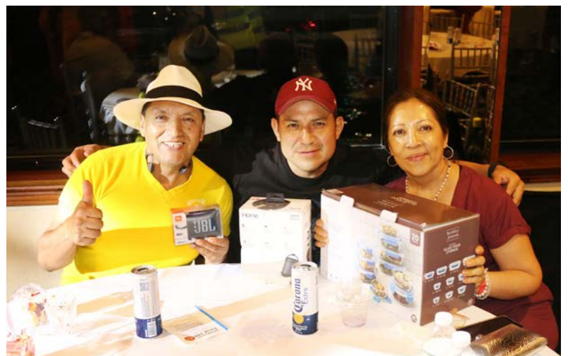
Members with prizes won at the UNITE HERE Local 100 Raffle.