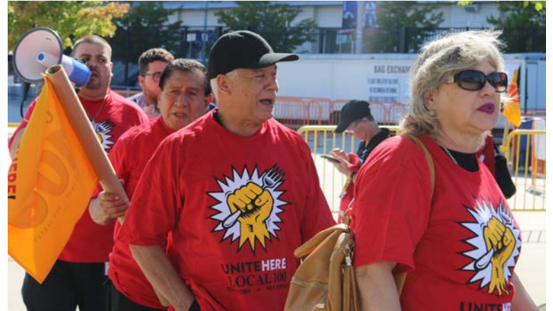
Trabajadores de Servicio de Comida que trabajan en Delaware North frente al Estadio MetLife.

incansablemente para apoyar al personal de infraestructura crítica, incluso durante los tiempos difíciles de la pandemia de COVID-19. La HTA es una gran victoria para los derechos de los trabajadores y reafirma nuestra misión colectiva de apoyar y elevar a nuestros miembros.