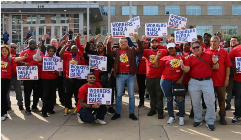
UNITE HERE Local 100 members at a rally in Philadelphia, supporting UNITE HERE Local 634

The rally highlighted the essential role these workers play in the school community and their struggles to make ends meet, despite their dedication. UNITE HERE Local 100 stands united with its fellow union members, emphasizing the importance of fair wages and worker rights.