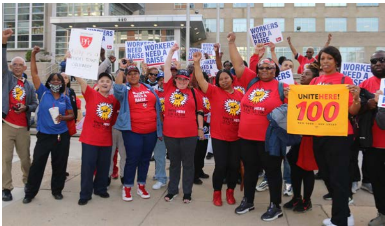
Miembros de UNITE HERE Local 100 en Filadelfia apoyando a UNITE HERE Local 634.

La manifestación destacó el papel esencial que desempeñan estos trabajadores en la comunidad escolar y sus luchas para cubrir sus necesidades, a pesar de su dedicación. UNITE HERE Local 100 se mantiene unido con sus compañeros sindicales, enfatizando la importancia de los salarios justos y los derechos de los trabajadores.