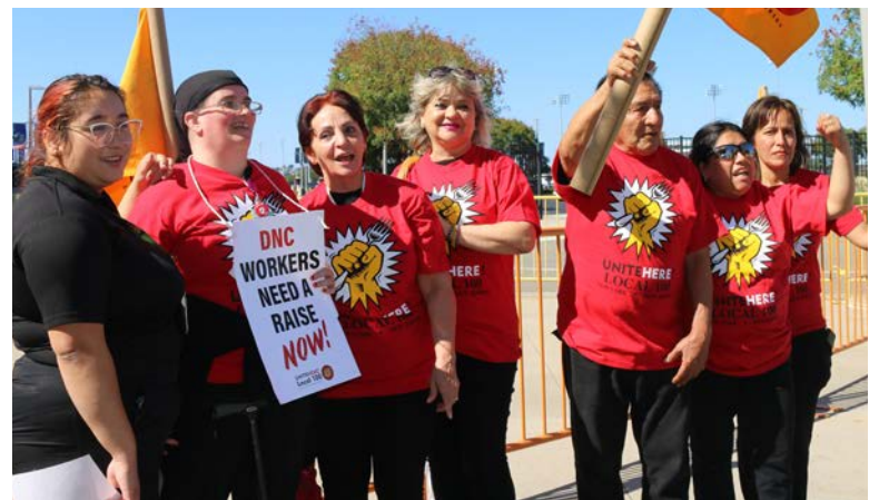
Trabajadores de Servicio de Comida que trabajan en Delaware North frente al Estadio MetLife luchando por un nuevo contrato.