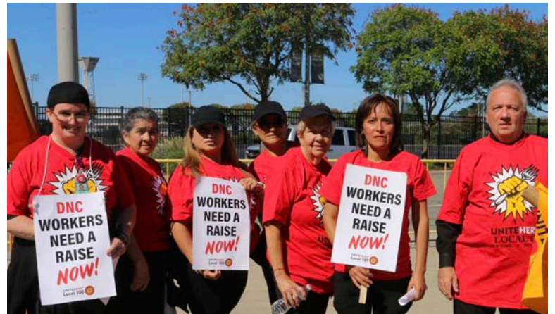
Delaware North members in front of MetLife Stadium for a rally