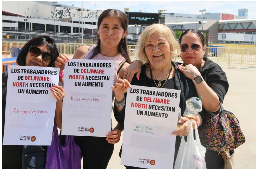
Members holding signs explaining why they needed a new contract with DNC at MetLife Stadium.