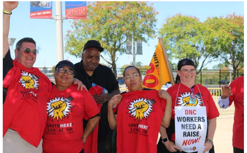
Delaware North Food Service workers in front of MetLife Stadium fighting for a new contract.