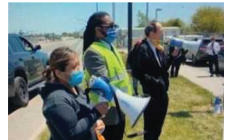
June 24th UNITED Airlines Catering workers and other Local 100 members rally demanding to keep 40-hour work week and Equality at the new United kitchen facility in Newark/El 24 de junio, los trabajadores de preparación de comida de UNITED Airlines y otros miembros de Local 100 se reúnen exigiendo mantener la semana laboral de 40 horas e Igualdad en las nuevas instalaciones de la cocina de UNITED en Newark.