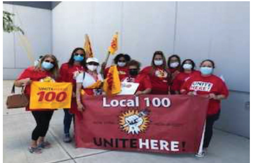
Members with masks at July 24th rally

Airports offering rent or other relief to employers should follow the precedent of the