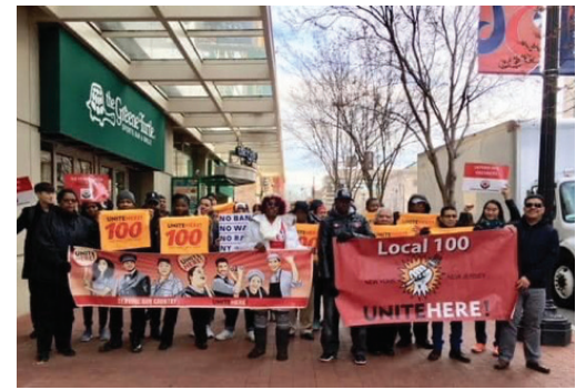
Local 100 celebrates Immigration Victory!

So, we celebrate very positive Supreme Court decisions