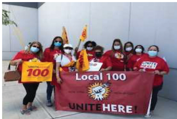
Miembros con mascarara en la demostración de julio 24.

Los aeropuertos que ofrecen alquiler u otro alivio a los empleadores deben seguir el precedente de la Ley CARES y requerir niveles de