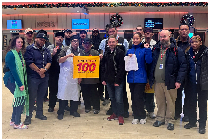
Members from MSG together after a successful delegation to the company. Miembros de Madison Square Garden juntos después de una exitosa delegación a la compañía.