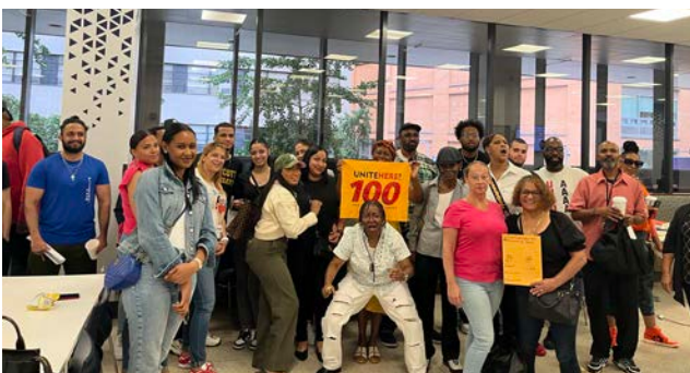
Members from Pace University upon successful ratification of the new Sodexo master contract. Miembros de Pace University tras la ratificación exitosa de un nuevo Contrato Maestro con Sodexo.