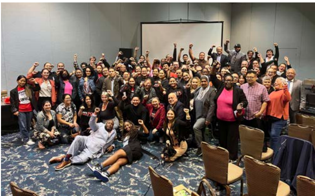
NY committee members from Google with committee members from UNITE HERE Locals across the country. Miembros del comité de Google de Nueva York con miembros de diferentes Locales de la Union Internacional.

The reason for these changes is to provide a fair system where members from all different workplaces share the same responsibility to pay dues and initiation fees in order to remain in good standing in Local 100 and be eligible to vote in Union elections and run for office.