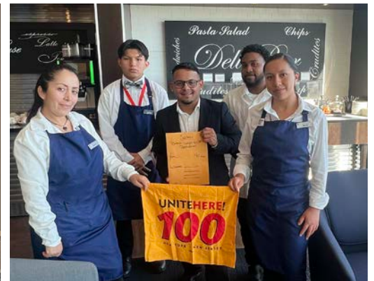
Members from British Airways Lounge in Newark Airport upon a successful contract ratification. Miembros de British Airways Lounge en el aeropuerto de Newark tras la ratificación exitosa de su contrato.