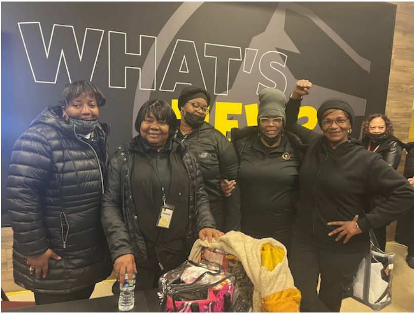
Members at Prudential Center after a successful contract ratification. Miembros de Prudential Center después de la exitosa ratificación de su contrato.