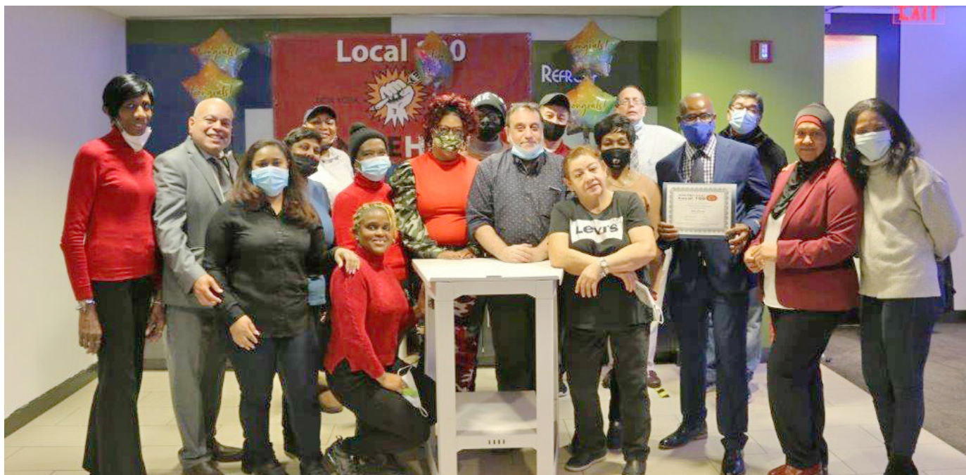
100 Members Union Kitchen First Graduation

expand the program and start a Taft Hartley Fund with employer contributions to bring more resources to the training program.