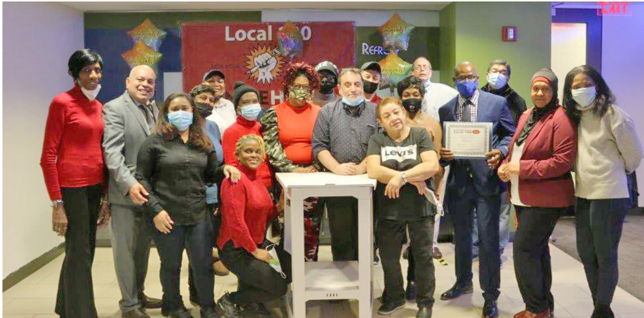
100 miembros en la Primera graduación de "100 Union Members Kitchen"

expandir el programa y comenzar un Fondo Taft Hartley con contribuciones de empleadores para traer más recursos al programa de capacitación