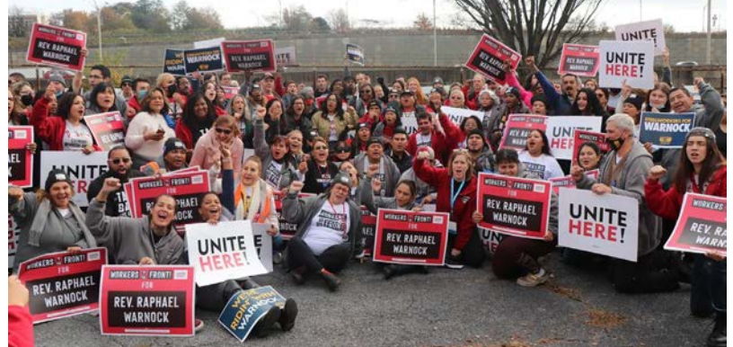
Los miembros de UNITE HERE Local 100 se unieron a miembros de nuestra Unión Internacional y muchas organizaciones para traer la Victoria tanto en Pensilvania como en Georgia.