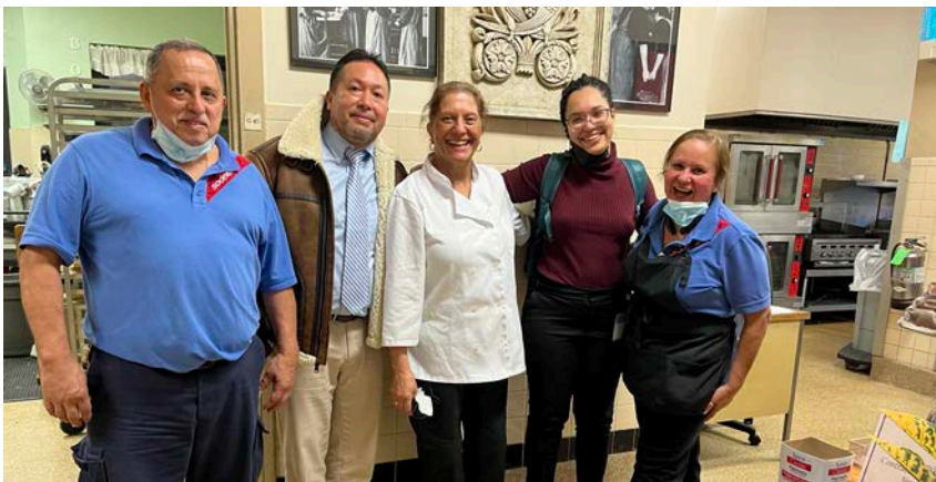
On October 27, 2022, Workers at Sodexo in MaryKnoll received recognition and joined our Union family. El 27 de octubre de 2022, los trabajadores de Sodexo en MaryKnoll recibieron un reconocimiento y se unieron a nuestra familia sindical.

Hemos organizado 3113 nuevos miembros con una meta de 5000 para 2024. Nuestros próximos objetivos serán los trabajadores del aeropuerto en la nueva terminal A en el aeropuerto de Newark, que se inaugurará este mes de enero.