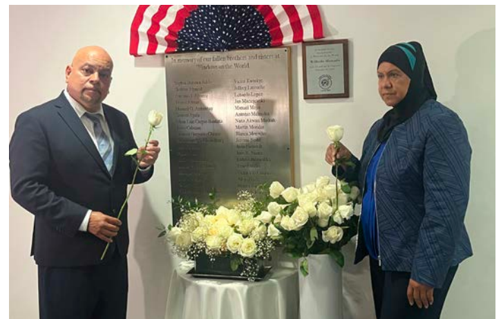
UNITE HERE Local 100 honors the 21st year anniversary of our fallen brothers and sisters in the Twin Tower Attack.