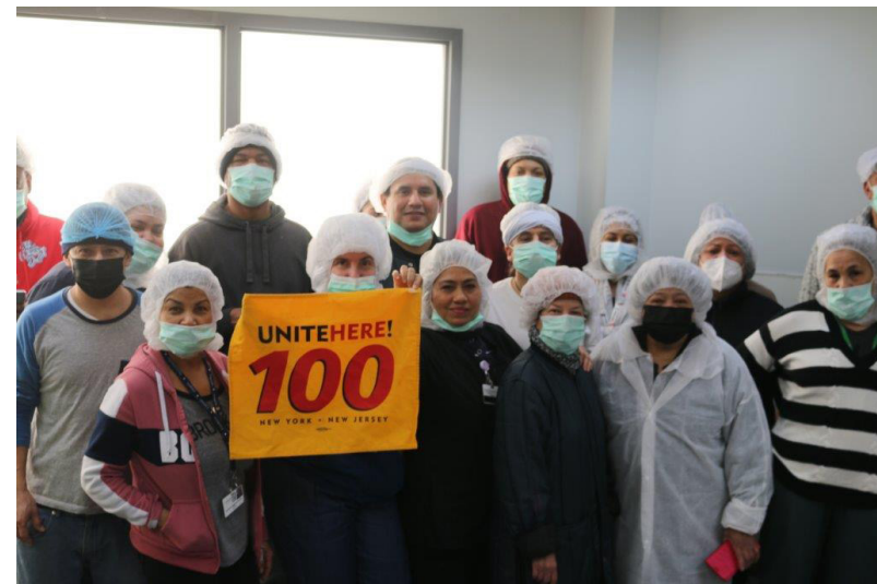
En el día Nacional de Acción en Nueva York, Le hicieron una Delegacion a la Compañia