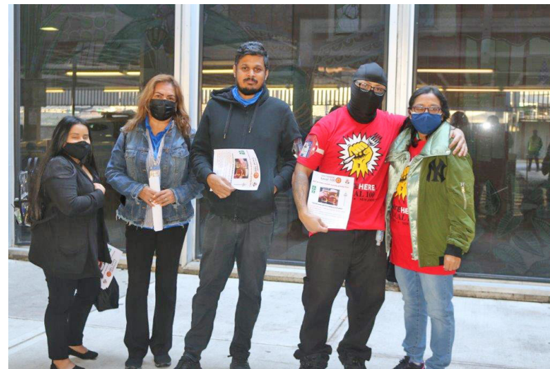
Después de varias acciones, trabajadores de OTG en JFL y LGA ganaron un contrato con Seguro Medico que comienza el primero de marzo 2022