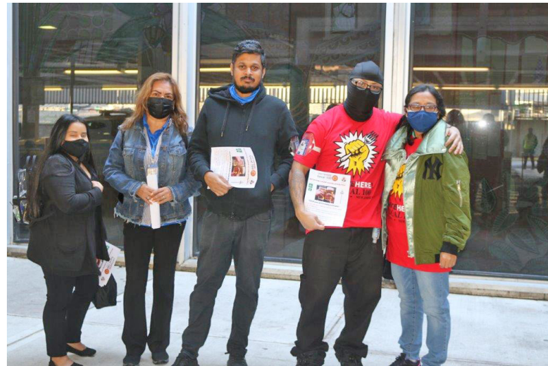
After several actions, OTG workers at JFK and LGA won a new contract with Union Health care coverage starting March 1st 2022.