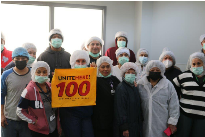
March 16th, 2022 National Day of Action in New York, a delegation was made to the Company.