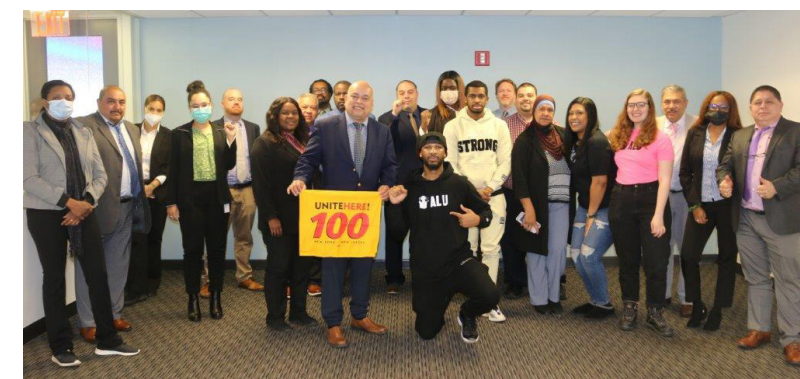
Martes, 8 de marzo de 2022, el presidente del Sindicato de trabajadores de Amazon de Staten Island, Christian Smalls y su equipo en la oficina de Local 100 después de una presentación sobre su esfuerzo de organización a los miembros del personal del Sindicato

La VICTORIA de "Amazon Labor Union" en la Ciudad de Nueva York es histórica para trabajadores y Sindicatos en todo el País.